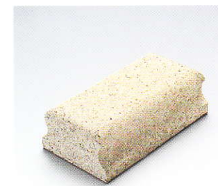
Cale manuelle dure, pour ponçage à sec