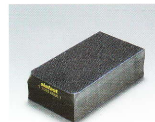
Cale manuelle double face: dure/souple, pour ponçage à l'eau