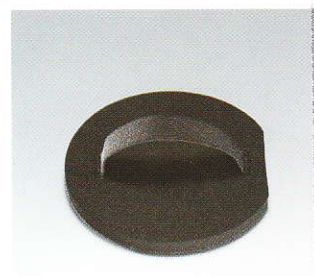
Cale manuelle ronde et souple pour disques siafast